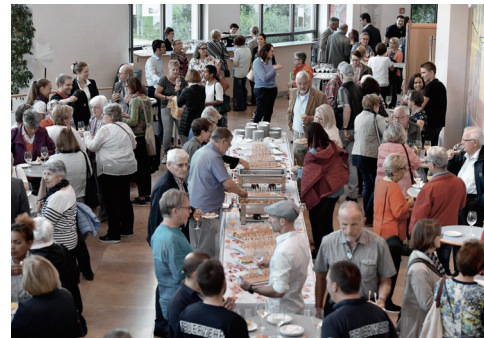
Ausgelassene Stimmung beim Apéro.