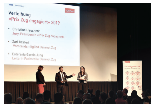
Die Gäste verfolgten voller Spannung die Preisverleihung.