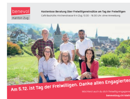
Dankesinserat in der «Zuger Zeitung».