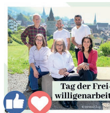
Spendenaktion der Zuger Kantonalbank.