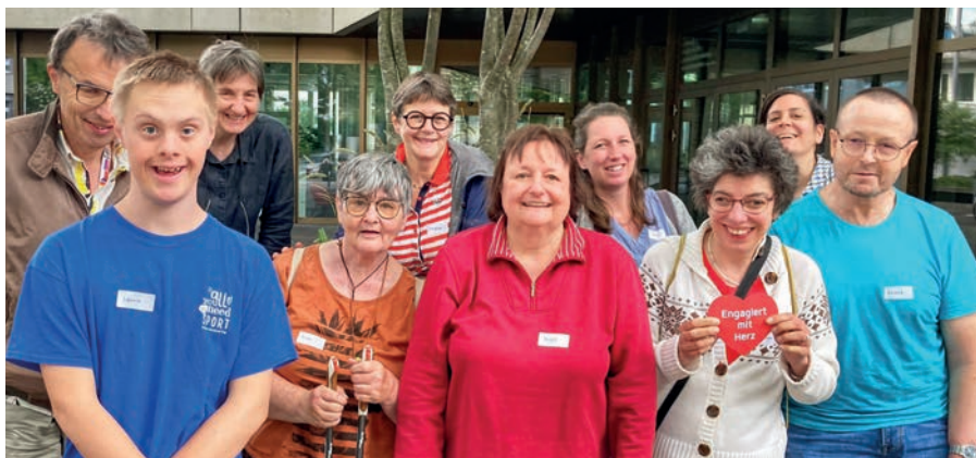
Teilnehmende des Kurses «Ich helfe mit».

Während der Aktionstage «Zukunft Inklusion» realisierten die Vereinigung insieme Cerebral Zug und Benevol Zug im Frühling im Rahmen des Bildungsclubs den Kooperationskurs «Ich helfe mit».