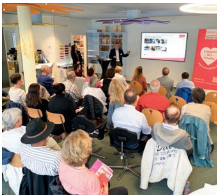
Mitglieder und Gäste im Begegnungsraum «hier mit dir».

Am 2. Mai 2024 konnte Benevol Zug in Anwesenheit von rund 40 Mitgliedern und Gästen im Begegnungsraum «hier mit dir», einer Initiative des Wohn- und Werkheims Schmetterling Cham, die 23. ordentliche Mitgliederversammlung erfolgreich durchführen.