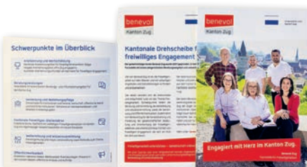
Der neue Flyer der Fachstelle.