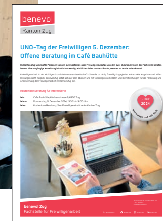
Plakat für die «offene Beratung».