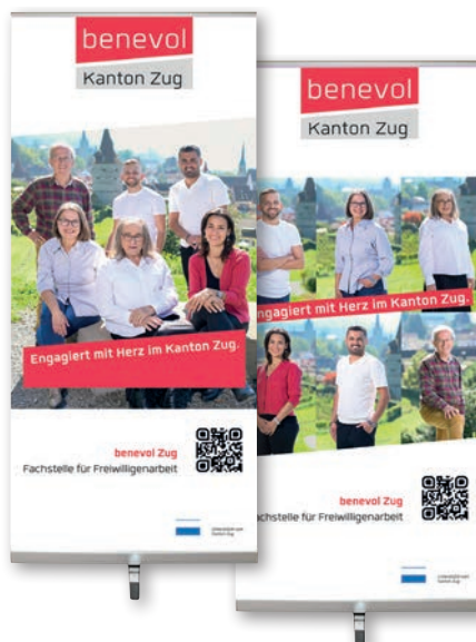
Rollup-Displays mit den neuen Bildern.