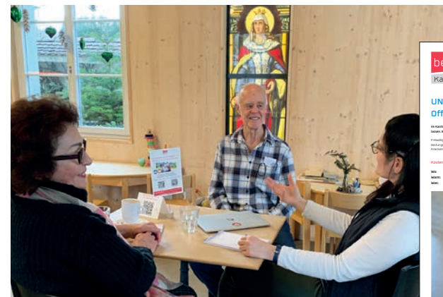
Erste «offene Beratung» im Café d'Bauhütte in Zug.

In der Ausgabe der «Zuger Zeitung» vom 5.12.24 hat Benevol Zug ein Dankesinserat geschaltet, um allen Engagierten im Kanton öffentlich zu danken für ihren grossartigen und wertvollen Einsatz für die Gemeinschaft.