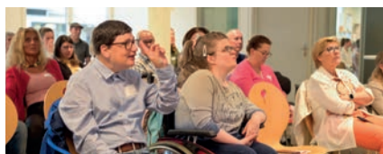
Das Wohn- und Werkheim Schmetterling stellt sich vor.