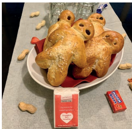
Grittibänz-Zmorge im «Intermezzo» in Zug.

Der mittlerweile im Kalender fest verankerte Grittibänz-Zmorge erfreut sich grosser Beliebtheit. So durfte Benevol Zug am frühen Morgen rund 40 Personen aus ihrem Mitglieder- und Partnernetzwerk im «Intermezzo» in Zug begrüssen. Bei gemütlichem Beisammensein, Austausch, Kaffee und leckeren Bänzen wurde das freiwillige Engagement im Kanton gewürdigt und verdankt.