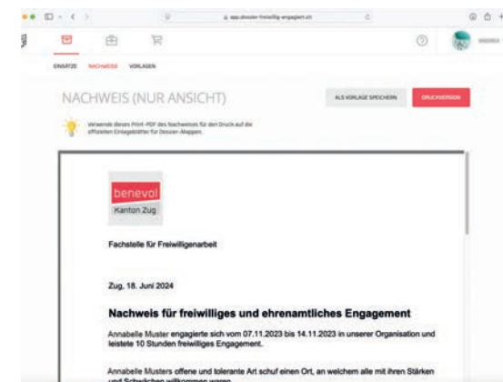
So sieht das «Dossier freiwillig engagiert» aus.

Immer öfter ergänzt der Nachweis für Freiwilligenarbeit das Bewerbungsdossier. Die Bewerbenden zeigen damit vorteilhaft, dass sie über wichtige Fähigkeiten wie Sozial- und Teamkompetenzen verfügen und einen Beitrag für die Gesellschaft leisten.