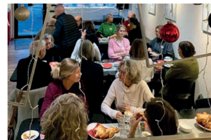
Gemütliches Beisammensein am Grittibänz-Zmorge.