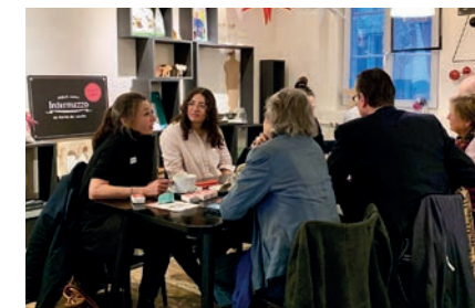
Angeregter Austausch im «Intermezzo» in Zug.